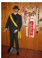
„Ein stummer Besucher“

Zur Hauptversammlung im März werde ich ein kleines Bilderalbum zusammenstellen, das man vielleicht auch nachbestellen kann.