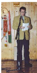
Turngau München Rainer N.