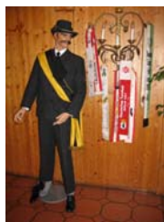
„Ein stummer Besucher“

Zur Hauptversammlung im März werde ich ein kleines Bilderalbum zusammenstellen, das man vielleicht auch nachbestellen kann.